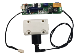
EHEC025-C und EHEC040-C